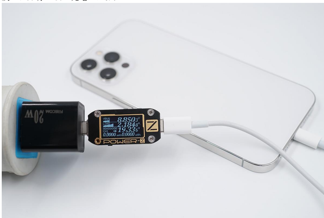
■iphone 12 Pro MAX 充電、電力は 8.85V、2.18A（容量 19.33W）で通常通り充電されます。