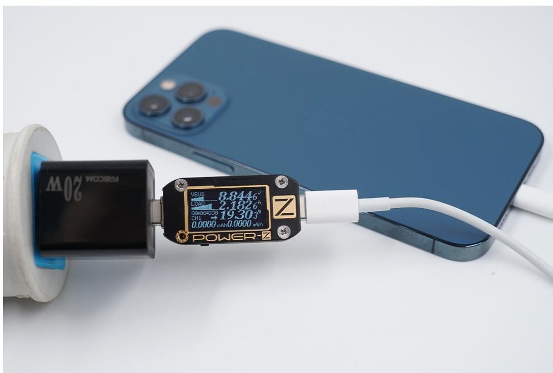
■iphone 12 Pro 充電際、電力は 8.84V、2.18A（容量 19.3W）及び、30分で50%充電されます。